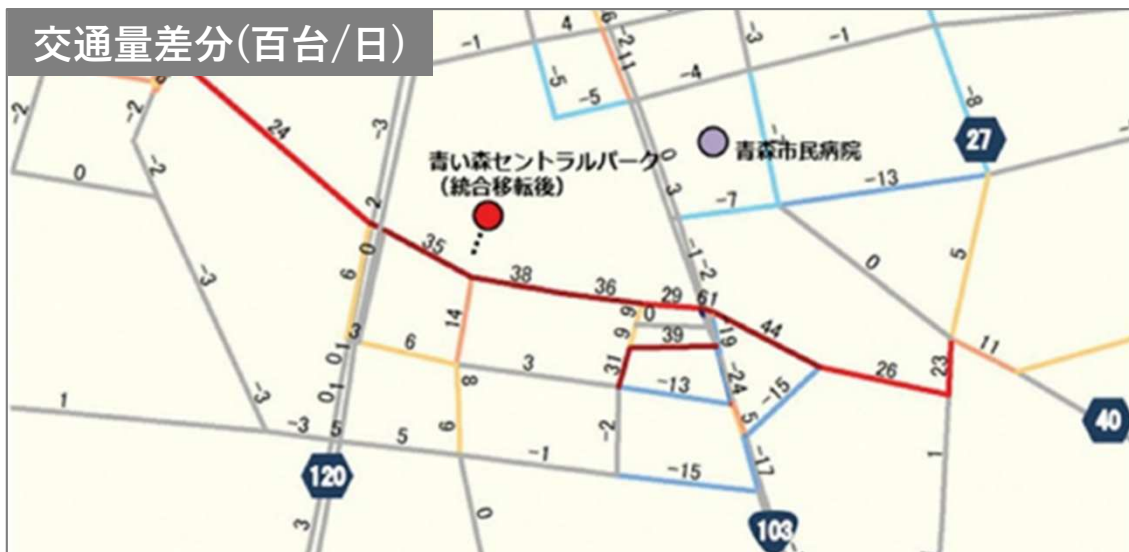
交通量差分(百台/日)