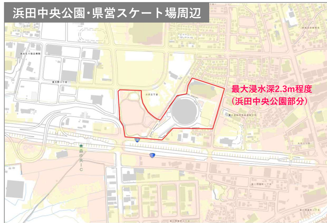
浜田中央公園・県営スケート場周辺