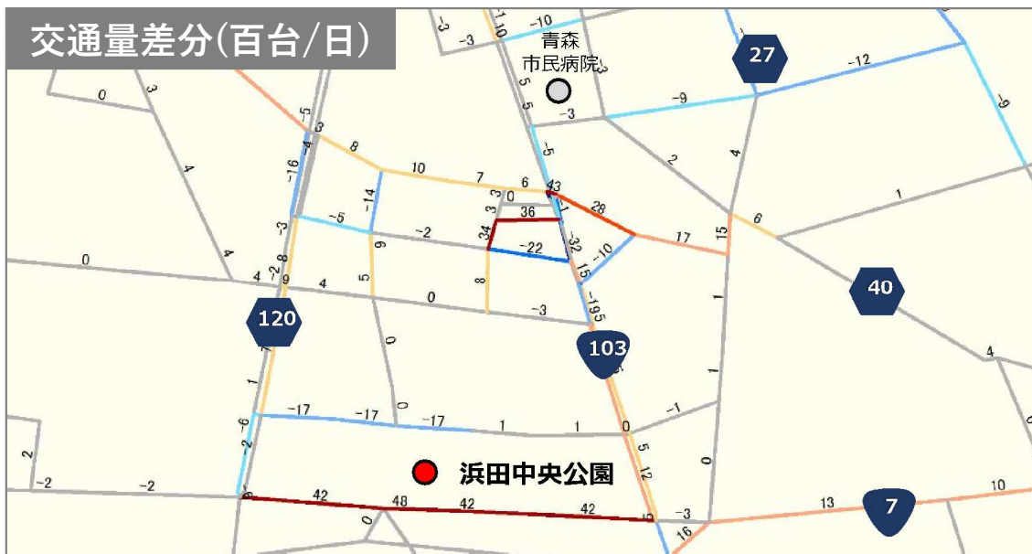
交通量差分(百台/日)