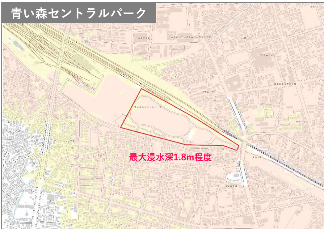
青い森セントラルパーク