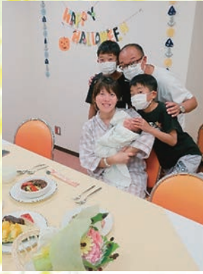
♡ お祝い膳を囲んで ♡