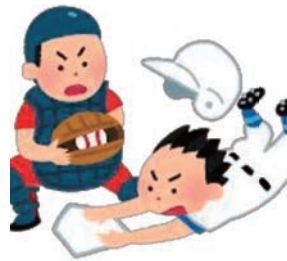
第61回北日本病院親睦野球大会組合せ