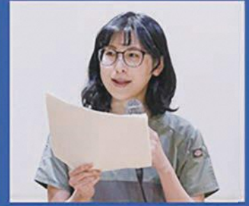
四ツ柳先生(研修医1年目)