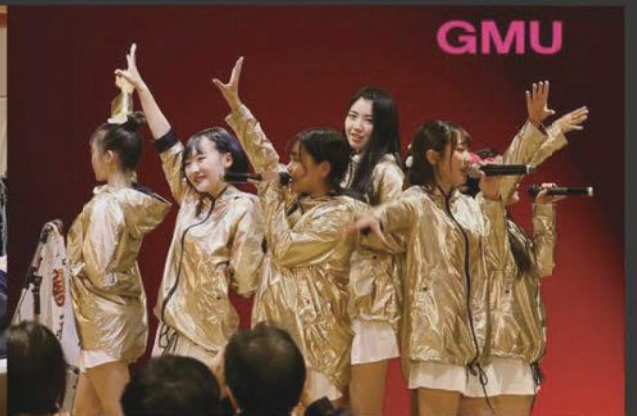
ゲスト GMU(青森市観光大使)