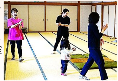
♪トトロの曲で「歩こう、歩こう～」

日頃運動不足のママたちは、「疲れたけど楽しかった。」「次回も参加したい。」と講師を輪の中心に講座を振り返っていました。