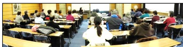
熱心に講義に耳を傾ける参加者

最後に、「選び方や組み合わせ方を工夫するだけでも、栄養バランスのとれた食事の実践に近づけます。1つでもできることから取り組んでみませんか？」と、講座を締めくくりました。参加者からは「今後の食生活に生かしたい。食事を見直すきっかけになった。少しずつ実践しようと思う。」等の感想があり、健康な食事の実践に前向きな様子を感じられた講座でした。