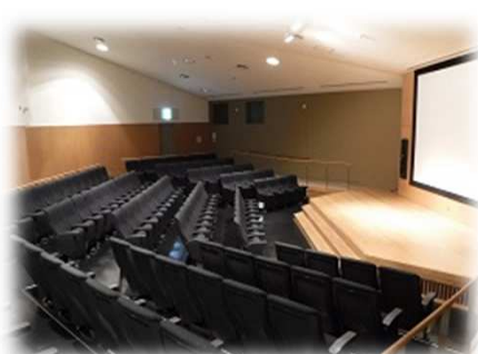
城跡案内所ホール