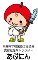
青森県学校栄養士協議会 食育推進キャラクター あぶにん