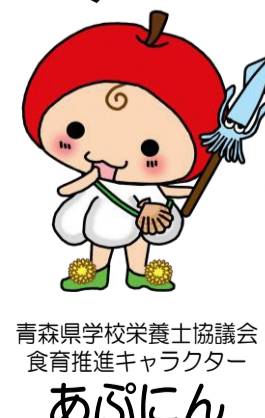
青森県学校栄養士協議会 食育推進キャラクター あぶにん

全国に出回っているさば缶の約半分は、青森県内で生産されています。とれたてを缶詰にするので栄養満点!