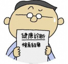
青森県健やか力向上推進キャラクター「マモルさん」

健康診断の結果、糖代謝(血糖、HbA1c)の項目が「要精検」、「要治療」になった方は、早めに医療機関で再検査を受けましょう。