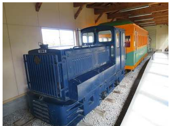
内部の森林鉄道機関車