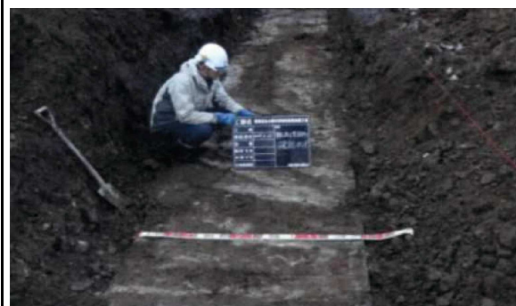
コンクリート製水路