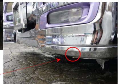
フロントバンパー 損傷