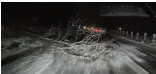
幹周100cm 樹高20m 片側2車線中、1車線(走行車線)をふさいでいた