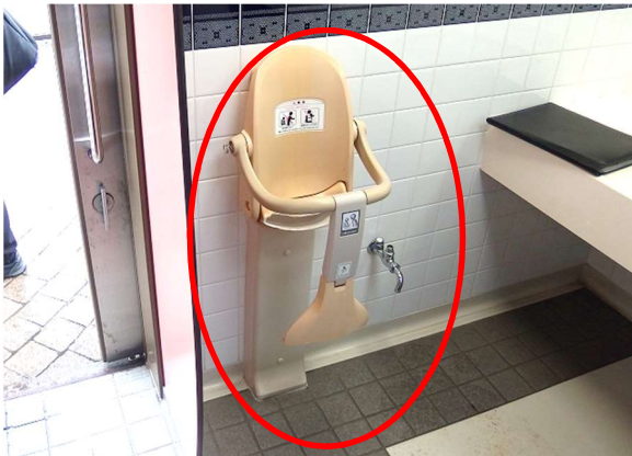
(ベビーチェア破損状況)