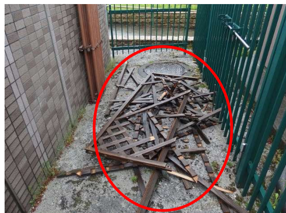
（トイレ裏側への放置状況）