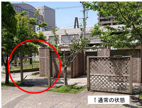
（○箇所 衝立破損被害）