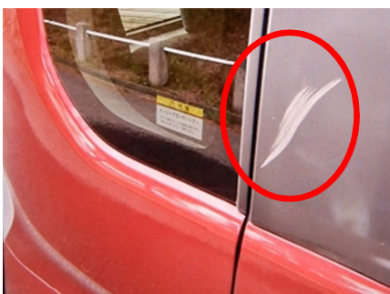
損傷箇所(右側後方ドアピラー)