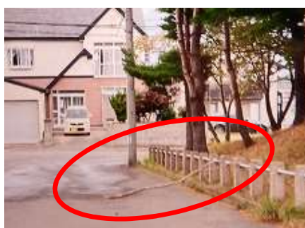
落下し飛び出した枯れ枝