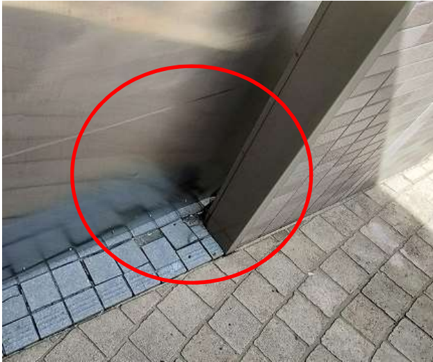
(○箇所 外れ落ちた入ロドア)