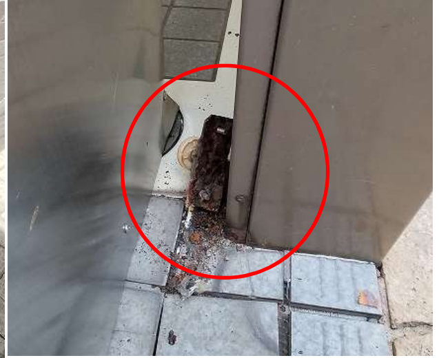
(○箇所 ずれ防止金具の破損)