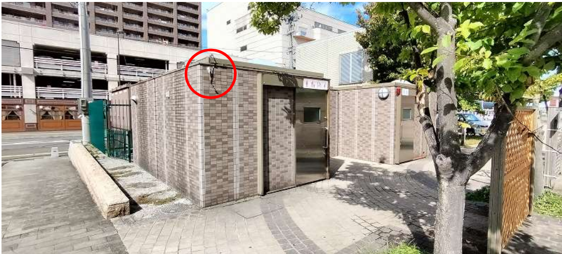
(○箇所 監視カメラ設置箇所)