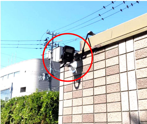
(○箇所 監視カメラ盗難前)