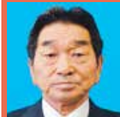
雲谷地区の高齢者

Q 雲谷地区の高齢者健康農園の倉庫棟外壁の破損箇所を修繕できないか。また、同農園へのアクセス道は、碎石で補修すると雨で流れてしまったため、今後、再生コンクリートで対応できないか伺います。