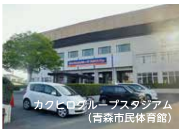
カクヒログループスタジアム (青森市民体育館)