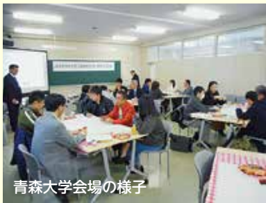
青森大会場の様子

平成29年11月19日（日）に議員とカダる会（議会報告会・意見交換会）を、大学生を対象に市内2会場（青森県立保健大学、青森大学）で開催しました。雪の降る悪天候の中、延べ13名（うち高校生1名）の皆様にご参加いただき、まことにありがとうございました。市議会では、今後も市民の皆様とリラックスした雰囲気の中で自由に意見交換できる場を設けてまいります。なお、当日の報告書は市議会ホームページでごらんいただけます。