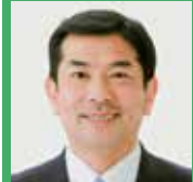
公明党 山本 武朝 やまもと たけとし

Q 国連サミットで採択した持続可能な開発目標SDGsを達成するため、次期学習指導要領では、持続可能な社会の担い手となる子どもたちに、どのような能力を育成しようとしているかお示しくください。