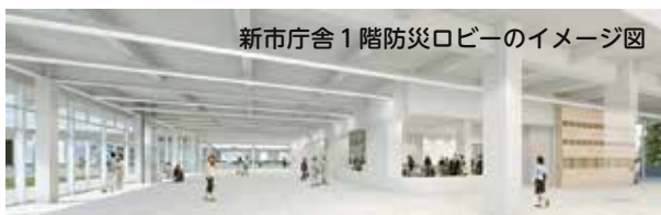
新市庁舎1階防災ロビーのイメージ図