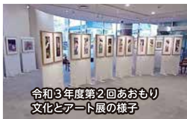
令和3年度第2回あomor文化とアート展の様子

教育委員会所管の美術作品は、学校にあるものを除き、2千880点あり、これらの作品を活用し、市民ホールにおいて「あomor文化とアート展」の開催や、古川市民センターや中世の館等においても作品の展示を行っており、引き続き、市民の皆様