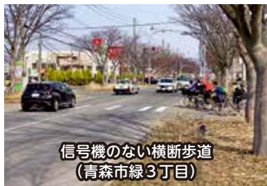
信号機のない横断歩道 (青森市緑3丁目)

市では、車の横断歩道手前での減速や横断歩道での歩行者優先は、道路交通法に規定されている交通ルールであるとの意識啓発を図ることが、交通事故及び死傷者等の減少に極めて重要と考えており、令和4年度は警察と連携し、信号機のない横断歩道手前におけるド