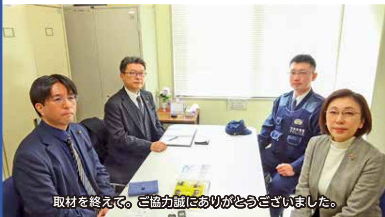
取材を終えて。ご協力誠にありがとうございました。