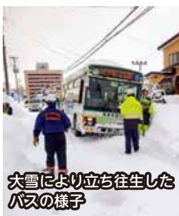
大雪により立ち往生したバスの様子

A 大雪により、市営バスが立ち往生した場合、交通障害を引き起こすことから、早期解消が必要であると認識しており、今後は、救出体制について、関係部署と情報交換を行い、検討してまいります。