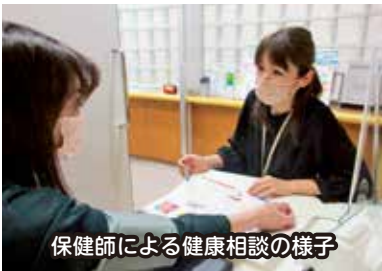
保健師による健康相談の様子

A 市では、令和7年度までの5か年を計画期間とする青森市定員管理計画を策定しており、保健師については、新型コロナウイルス感染症の拡大防止の体制強化を図るため、令和3年度は5人増員し、令和4年度は6人増員する予定であり、これにより、保健師の職員数は、令和4年度には62人となる予定です。