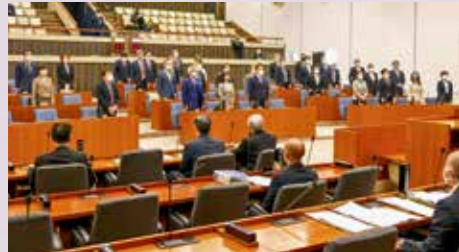
決議採決の様子 (起立総員)

2月24日にロシアがウクライナへ侵攻した行為に対して、本市議会では、「力を背景とした一方的な現状変更をしようとする軍事侵攻は、明白な国際法違反であり、断じて容認することができず、厳しく非難」し、「即時ウクライナに対する攻撃を停止し、完全撤退を求め」、「政府においては、ウクライナに対する人道支援や、現地在留邦人の安全確保に努めるとともに、国際社会と緊密に連携し、毅然たる態度でロシアに対して迅速かつ厳格な制裁措置を取るよう強く要請する」内容の決議が3月4日に提案され、同日、起立総員で可決しました。