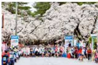
2023あおもり桜マラソンのスタート地点の様子

A 参加者を対象としたアンケート等では、ゴール会場の手荷物受取所において、参加者への手荷物返却に長時間を要したこと、青森駅のシャトルバス乗り場において、長い行列が発生したなどの意見がありました。今後は、地域や関係機関と協議しながら、できる限り改善していきたいと考えており、あおもり桜マラソンが全国のランナーから選ばれる大会となるよう、魅力向上に取り組んでまいります。