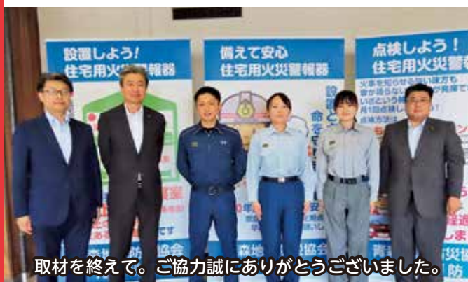
取材を終えて。ご協力誠にありがとうございました。

〔議員〕 市民の生命・財産を守るために、日夜活動されている皆さんに心から感謝します。本日はお忙しい中、ありがとうございました。