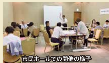
市民ホールでの開催の様子