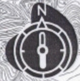
図1 横内浄水場水源保護区域