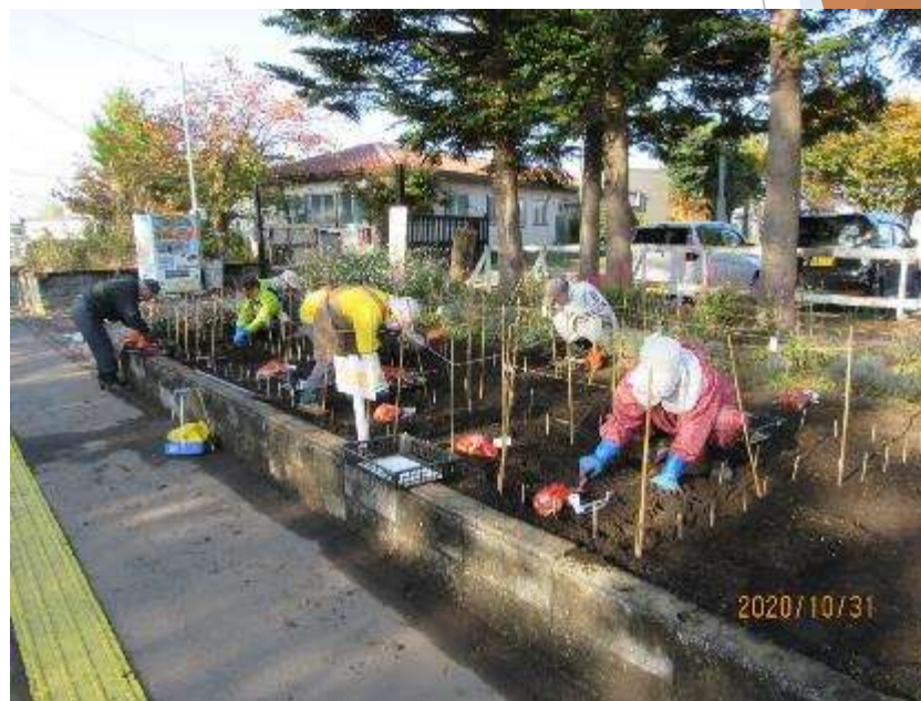
令和2年10月球根植え付けの様子