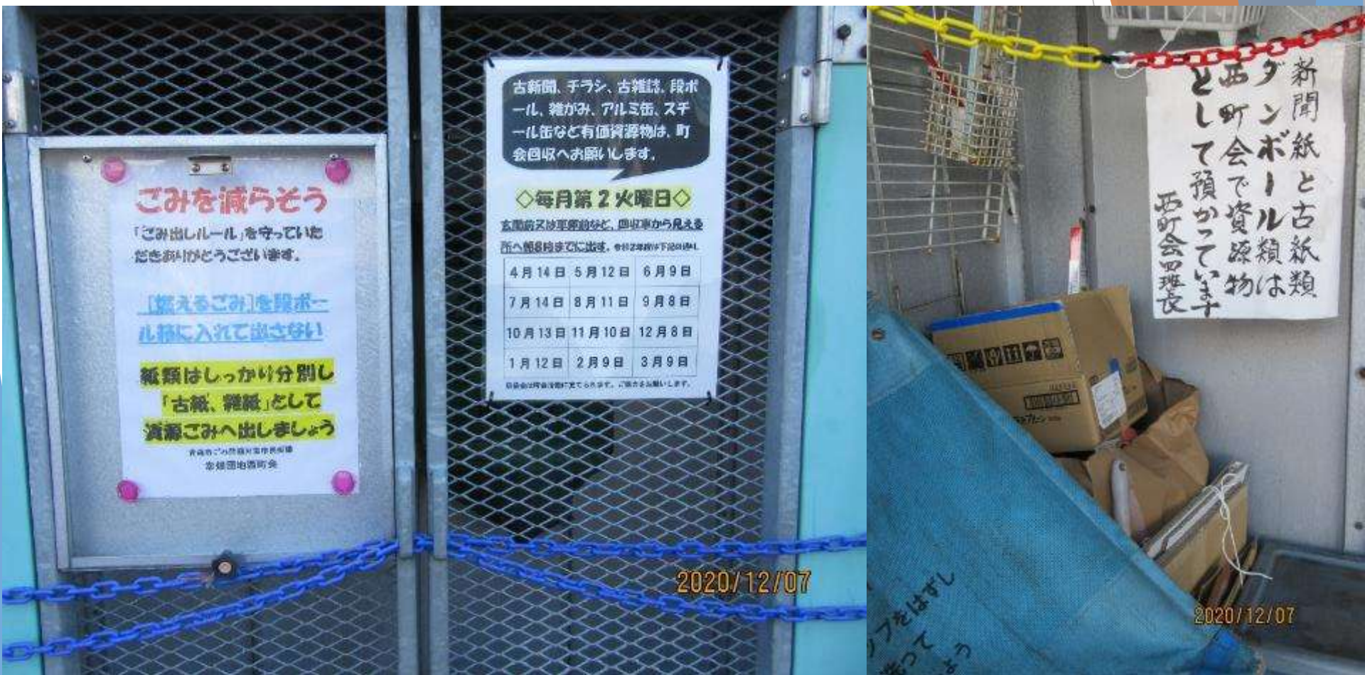
ごみ集積場所での掲示