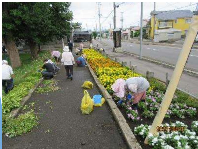
令和2年8月花壇手入れの様子