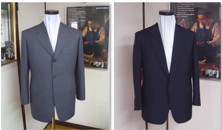
匠の技が創り出す、あなただけの逸品です。