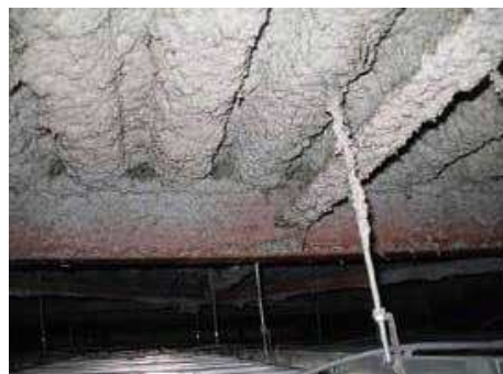
※天井内部に使用されている例

アスベストに、セメント等の結合材を重量で30~40%混入し、水を加え吹付け施工されたものです。