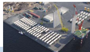
基地港湾のイメージ図