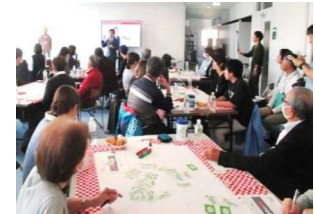
あおもり未来ミーティング

■ みんなで対話を深める「あおもり未来ミーティング」などにより、未来志向の新たなアイデアを把握し、市政に反映