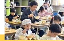
小学校の給食（西市長参加）