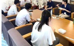
市長と職員のランチミーティング

■ lon1ミーティングやワークショップ形式の研修などによる、政策立案能力の向上及び職員同士のコミュニケーションの活性化