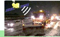
ICT除雪のイメージ図