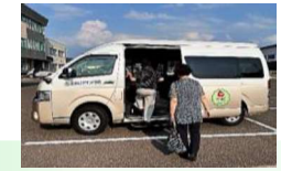
浪岡AIデマンド交通