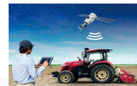
スマート農業のイメージ図