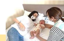
助産師による産後ケア