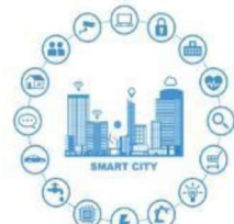
スマートシティのロゴマーク

■ 「DX先進都市 青森市」の実現に向け、デジタル技術や外部人材等を活用し、「市民力＋民間力」により、地域課題の解決や新たな価値を創出するスマートシティをはじめとするDXを推進