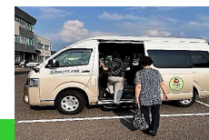
浪岡AIデマンド交通