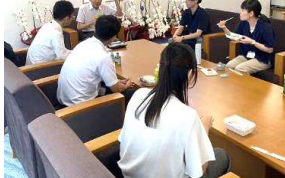
市長と職員のランチミーティング

■ 1on1ミーティング やワークショップ形式の研修などによる、政策立案能力の向上及び職員同士のコミュニケーションの活性化