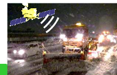
ICT除雪のイメージ図