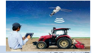
スマート農業のイメージ図