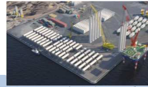
基地港湾のイメージ図