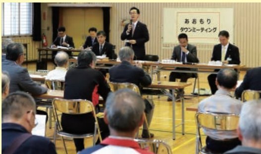
あおもりタウンミーティング

地域の声を傾聴する「あおもりタウンミーティング」や市民意識調査など、多様な手段により、地域課題・市民ニーズなどを把握します。