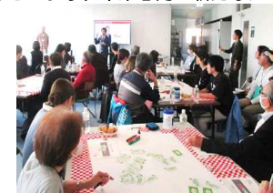
あおり未来ミーティング

■ みんなで対話を深める「あおり未来ミーティング」 などにより、 未来志向の新たなアイデア を把握し、市政に反映