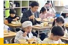
小学校の給食（西市長参加）