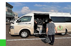
浪岡AIデマンド交通