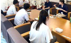
市長と職員のランチミーティング

■ 1on1ミーティング やワークショップ形式の研修などによる、政策立案能力の向上及び職員同士のコミュニケーションの活性化