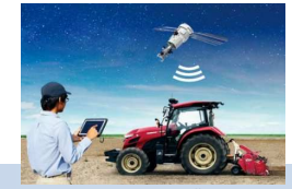
スマート農業のイメージ図