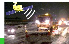
IT除雪のイメージ図