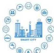
スマートシティのロゴマーク

■ デジタル技術や外部人材等を活用し、「 市民力+民間力 」により、地域課題の解決や新たな価値を創出する スマートシティ をはじめとする DX を推進