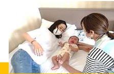
助産師による産後ケア