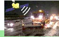
ICT除雪のイメージ図