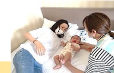
助産師による産後ケア