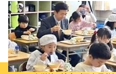
小学校の給食 (西市長参加)