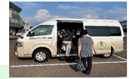
浪岡AIデマンド交通