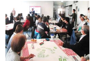
あおもり未来ミーティング

■ みんなで対話を深める「あおもり未来ミーティング」などにより、未来志向の新たなアイデアを把握し、市政に反映