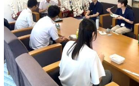
市長と職員のランチミーティング

■ 1on1ミーティングやワークショップ形式の研修などによる、政策立案能力の向上及び職員同士のコミュニケーションの活性化