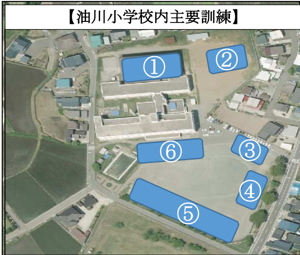
【油川小学校内主要訓練】