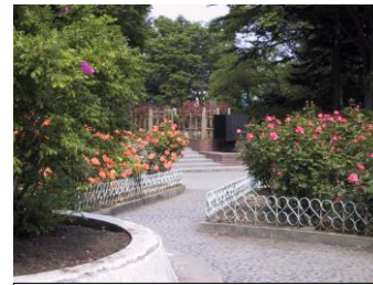
バラ園と「平和都市宣言記念碑」