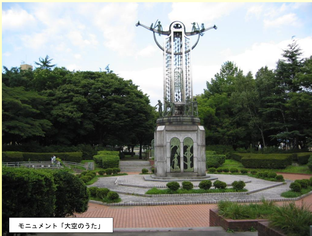
モニュメント「大空のうた」

園内には約100種、7,000本の樹木が植栽されているほか、子供と鳩を配して永遠の平和を託した回転式モニュメント「大空のうた」や平和都市宣言記念碑、大花壇、バラ園、憩いの中心となる大型噴水などがあり、未来と平和を祈念している。