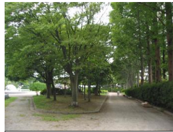
ジョギングコースを兼ねる園路 (1周 700m)