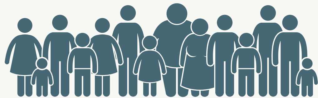
市民サービスの向上

人口減少やデジタル化などを背景に、複雑化・多様化する行政ニーズに対応するため、公民各々のリソースを結集し、行政課題や地域課題の解決に資する新たな価値を共創する。