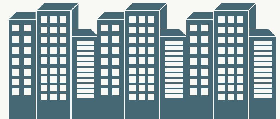
地域経済の活性化