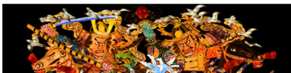
青森ねぶた祭 × Creema アップサイクルプロジェクト