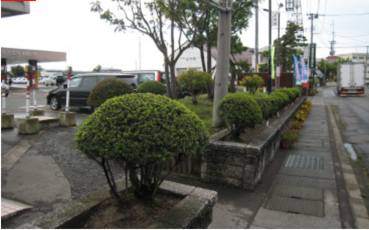
浪岡庁舎敷地西側 ~ 県道