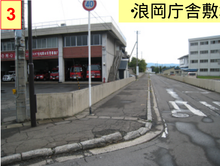
浪岡庁舎敷地南側 ~ 市道