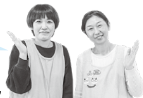
つどいの広場「さんぽぽ」スタッフ