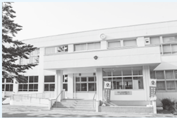
縄文の学び舎・小牧野館に「文化遺産課」を設置します

病院の在り方に関する検討を促進するため、市民病院事務局総務課内に「病院整備準備室」を設置します。