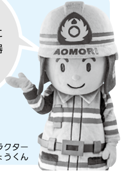
青森消防マスコットキャラクター あおしょうくん

諸般の事情により、中止となる場合があります。中止の際は消防本部ホームページ( https://www.city.aomori.aomori.jp/kouiki/syoubou/top.html )に掲載します。