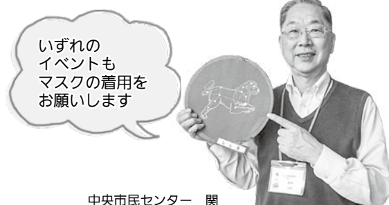
中央市民センター 関

プラネくと星空さんぽ 絵話「にげだしたパンがし」 (幼児向け・約40分) 日曜日・祝日 11:00 (17日除く)