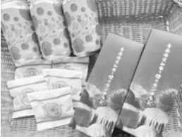
令和3年度 開発商品