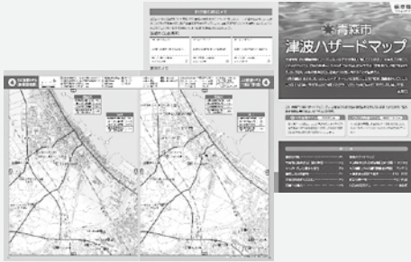
▲青森市津波ハザードマップ

津波による被害を最小限に留めるには、一人ひとりが防災の意識をもって、日頃から準備をすることが大切です。家族や地域で避難場所や避難経路などを話し合っておきましょう。