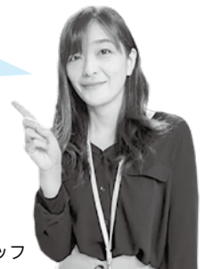
健康づくり推進課 スタッフ