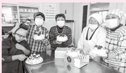
▲横内地区 ほのぼの交流会 一人暮らしの方々と一緒にケーキ作り

これからも、見守りが必要な世帯への声掛けはもちろん、登下校の子どもの見守りにも力を入れていきます。みなさん、困りごとがありましたら、気兼ねなく、私たち民生委員に相談してください。