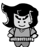
青森市観光キャラクター ねぶたん

◆支援額:町(内)会・地域運行団体 1団体につき6万円 圃圃6月17日(金)までに、青森ねぶた祭実行委員会事務局(☎017-723-7211)へ