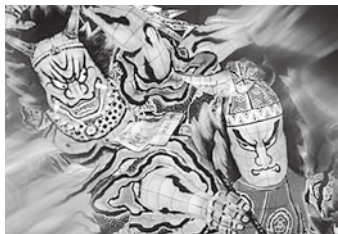
▲2019 推薦/武者激突 小笠原敦司(青森市)

2022青森ねぶた祭に関する写真を募集します。入賞作品は、ねぶたの家ワ・ラッセに展示するほか、PRに使用します。詳細は、お問合せください。