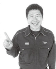
消防本部予防課 最上