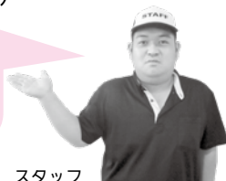
モヤヒルズ スタッフ

ファミリーパック割引は 合計金額から割引。 4枚以上購入時の割引に ついてはお問合せください。