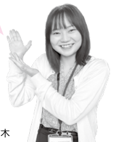
健康づくり推進課 枋木

個別健診・検診は指定医療機関で受診できます。直接、医療機関にご予約ください(医療機関によって受診可能な内容は異なりますので、お問合せください)。