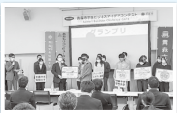
11月27日、青森市学生ビジネスアイデアコンテスト「ABCゲート」。県産ホタテを使ったパスタソースを台湾へ輸出するプロジェクトを進める青森商業高校の皆さんも観戦。

11月27日、青森市学生ビジネスアイデアコンテスト「Aomori Business Challenge GATE」へ。大学等から選ばれた6チームが独自のビジネスアイデアを披露。優勝は青森大学、2位に青森公立大学、3位が青森中央学院大学でした。新しい発想で地域を盛り上げてくれることに期待します。