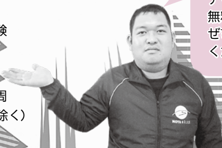
モヤヒルズスタッフ

インストラクターによる引き馬で乗馬コースを1周 Ⓜ 5月3日(水) 10:00~15:00(12:00~13:00除く)