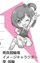
青森競輪場 イメージキャラクター 葵 明輪