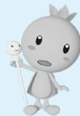
青森市環境保全キャラクター 地球の王子様「エコル」