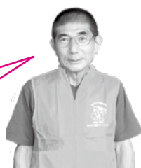
健康づくりリーダー协会会长 戸山地区健康づくりリーダー

終わったときに、しっかり体に効いた、いつもよりたくさん動けたと、一人では味わえない満足感を得られるように、組立てや強度を考えています。また、何のために行うのか、運動の狙いと効果を説明できるように心掛けています。