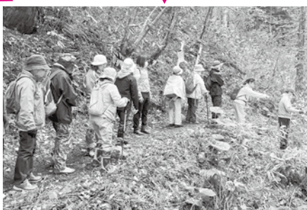
▲健康ウォーキング