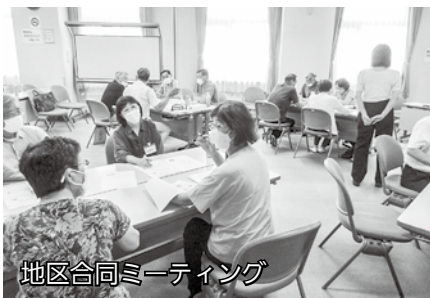
地区合同ミーティング