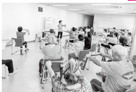
▲地域の体力づくり講座

「私の住む地域ではこんなことで悩んでいて…」 「こうすれば、参加者がもっと楽しめそうだ！」