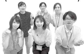
健康づくり推進課 地区担当保健師