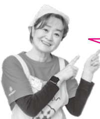
食生活改善推進員协会会长 中央地区健康づくりリーダー