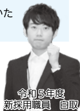
令和5年度 新採用職員 自取

令和6年度 青森市立 高等看護学院学生募集 願書受付▽12月11日(月)～ 22日(金) 試験日▽令和6年1月20日 (土) 試験会場▽青森市立高等看護 学院 募集人員▽40人