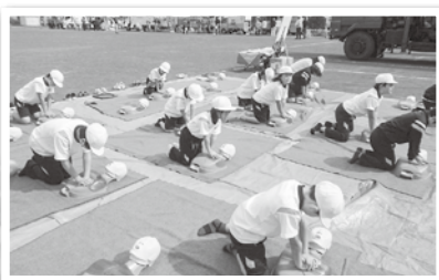
9月30日 令和5年度青森市総合防災訓練。訓練を通じて防災意識の醸成に努め、誰もが安心して暮らせるまちづくりを進めてまいります。

災害はいつ起きるか分かりません。ハザードマップの確認や青森市メールマガジン(防災情報)の登録などご家族で日頃から災害への備えをお願いします。