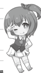
青森競輪場 イメージキャラクター 葵 萌輪