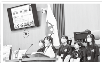
11月19日 青森市子ども会議フォーラム2023 子どもたちが青森市に誇りをもって、これからの道を歩んでいくことが未来の青森市を創っていく原動力になります。