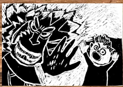
▲造道小学校の版画

時 3月2日(土) 10:00～16:00、3日(日) 10:00～15:00 所 協同組合タッケン美術展示館 2～3階 内 市内8小学校(造道、浪打、小柳、戸山西、堤、三内、三内西、沖館) 児童の作品131枚、メイン州の小学生の作品100枚を展示 問 青森モーニングロータリークラブ (新岡、☎090-3753-2019)