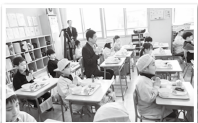
1月16日 青森県産ホタテを学校給食で食べて応援！3月までに、市内の全小・中学校で県産ホタテを使った給食を月2回提供する予定です。

今後も青森市の未来を担う若者が生き生きと活躍できるよう全力で応援してまいります。