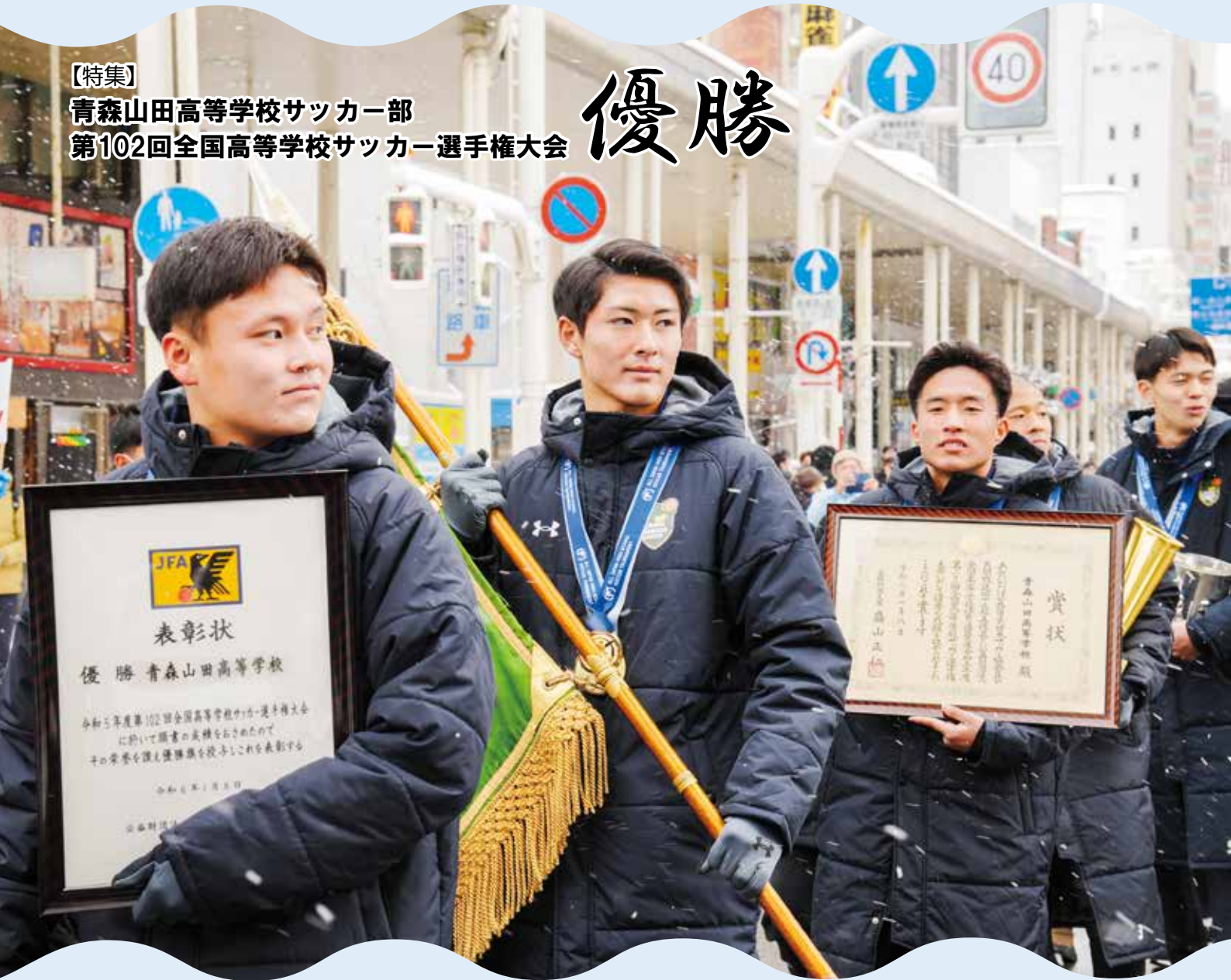
写真：第102回全国高等学校サッカー選手権大会 青森山田高等学校サッカー部優勝パレード (1月16日/新町通り)