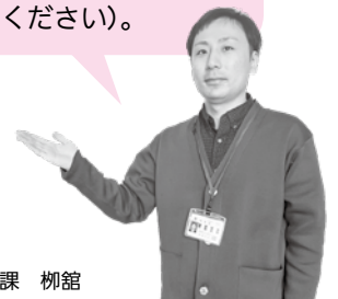
健康づくり推進課 柳館

個別健診・検診は指定医療機関で受診できます。直接、医療機関にご予約ください(医療機関によって受診可能な内容は異なりますので、お問合せください)。