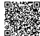
コロナ罹患後症状対応医療機関

高齢者新型コロナワクチン接種は10月から実施しています。詳しくは、市ホームページまたは本紙9月号をご覧ください。